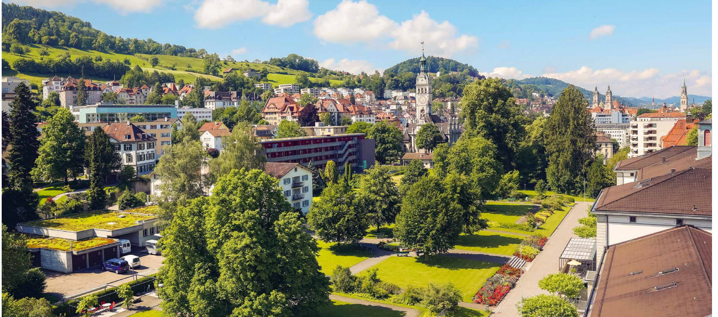
Aussicht auf den Singenberg.